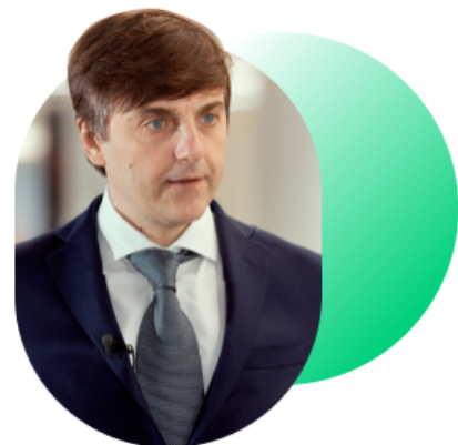
Кравцов Сергей Сергеевич,

Она дает молодежи возможность увидеть свое место в будущем страны, внести личный вклад в развитие науки, промышленности, экономики. Именно поэтому работа по профориентации проводится в школах в рамках внеурочной деятельности, охватывает всю систему дополнительного образования. Очень ценно, что сегодня к ней активно присоединяется профессиональное сообщество, те, кто напрямую взаимодействует с нашими замечательными и талантливыми ребятами.